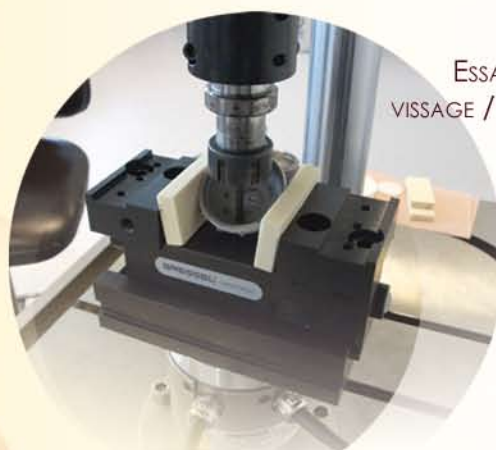
ESSAI DE VISSAGE / DÉVISSAGE