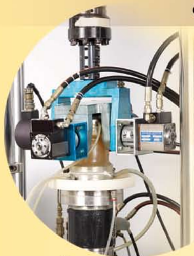
BANC DE TRIBOLOGIE 4 AXES