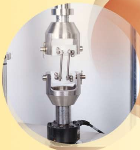
ESSAI DE FATIGUE