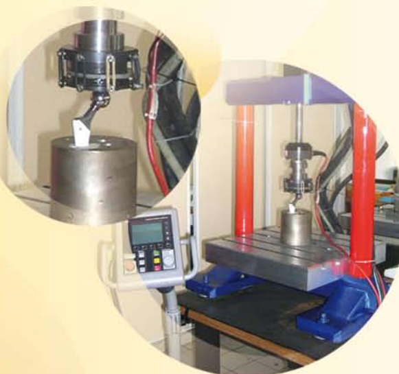
ESSAI DE COMPRESSION DYNAMIQUE

Une présentation plus détaillée de nos prestations est disponible sur notre site Internet www.critt-mdts.com